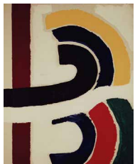
Abb.: T. Moffat