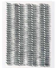
Abb.: F. Jacob