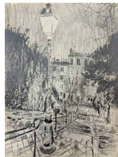
Abb.: P. Reichenberger