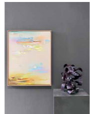
Abb.: © L. Wells, courtesy Van der Grinten Galerie, Köln Eröffnung am Freitag 24. Januar von 18 bis 21h