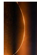
Eröffnung am Freitag 24. Januar von 18 bis 21h